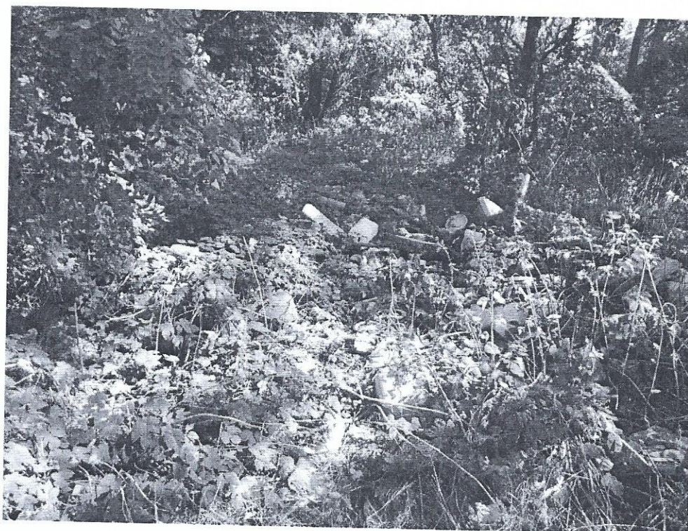
Fot. 4 Widok na odpady zgromadzone przy zachodniej granicy działki