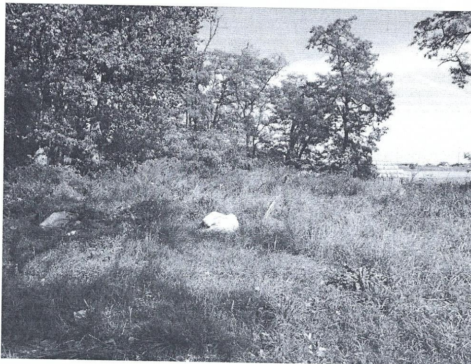
Fot. 1 Widok na południowo-wschodni bezdrzewny fragment działki położony najbliżej drogi dojazdowej zasypany odpadami