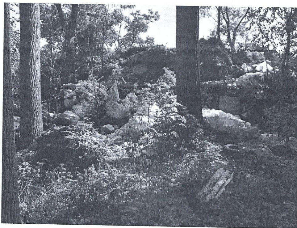
Fot. 2 Widok na południowo-wschodnia skarpę zagłębienia – miejsce ciągłego wysypywania odpadów